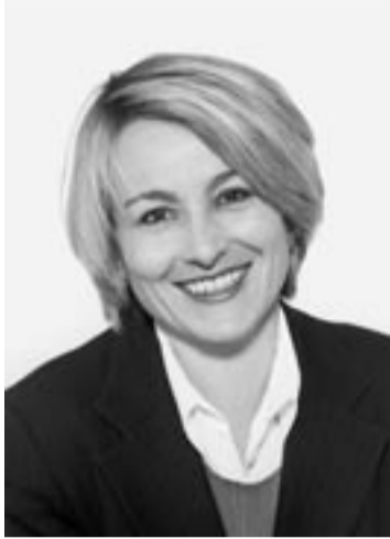
Véronique Pürro, Députée.